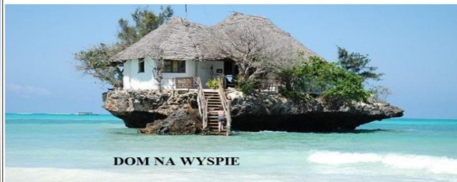
DOM NA WYSPIE