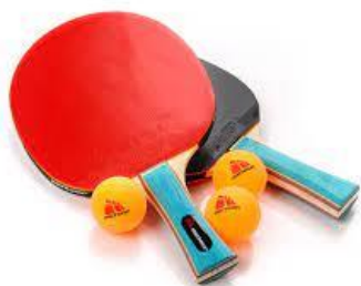
rakiętę do tenisa stołowego