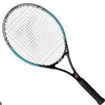
rakiętę do tenisa ziemnego