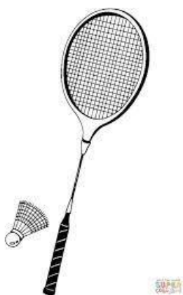
rakieta do badmintona